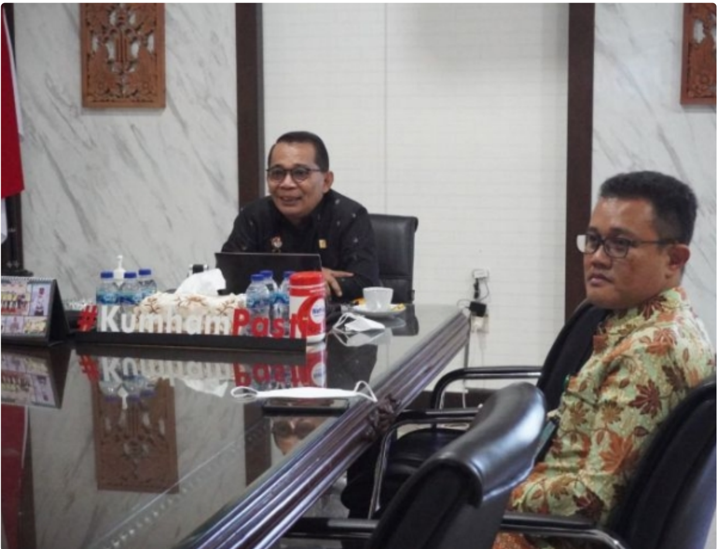
Pimpin Rapat MPWN Jateng, Kakanwil Bahas Pemilihan Wakil Ketua MPW Yang Baru

SEMARANG - Terkoneksi secara virtual melalui Aplikasi Zoom, Kantor Wilayah Kementerian Hukum dan HAM Jawa Tengah menggelar rapat Majelis Pengawas Wilayah (MPW) Notaris Jawa Tengah yang membahas tentang Pemilihan Wakil Ketua MPW baru Tahun 2022, pada Kamis (02/09/2022).