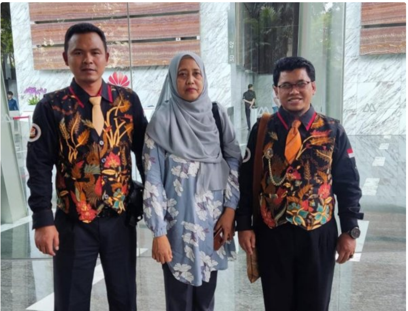
Foto: Tim LIDIK KRIMSUS RI melaporkan dugaan penyimpangan ini ke Komisi Pemberantasan Korupsi (KPK) dan Otoritas Jasa Keuangan (OJK), menuding adanya praktik kotor yang dilakukan oknum PT. Bank Negara Indonesia (Persero) Tbk di Kota Semarang. Senin (04/11/2024).

JAKARTA- Tim Divisi Hukum Lembaga Informasi Data Investigasi Korupsi dan