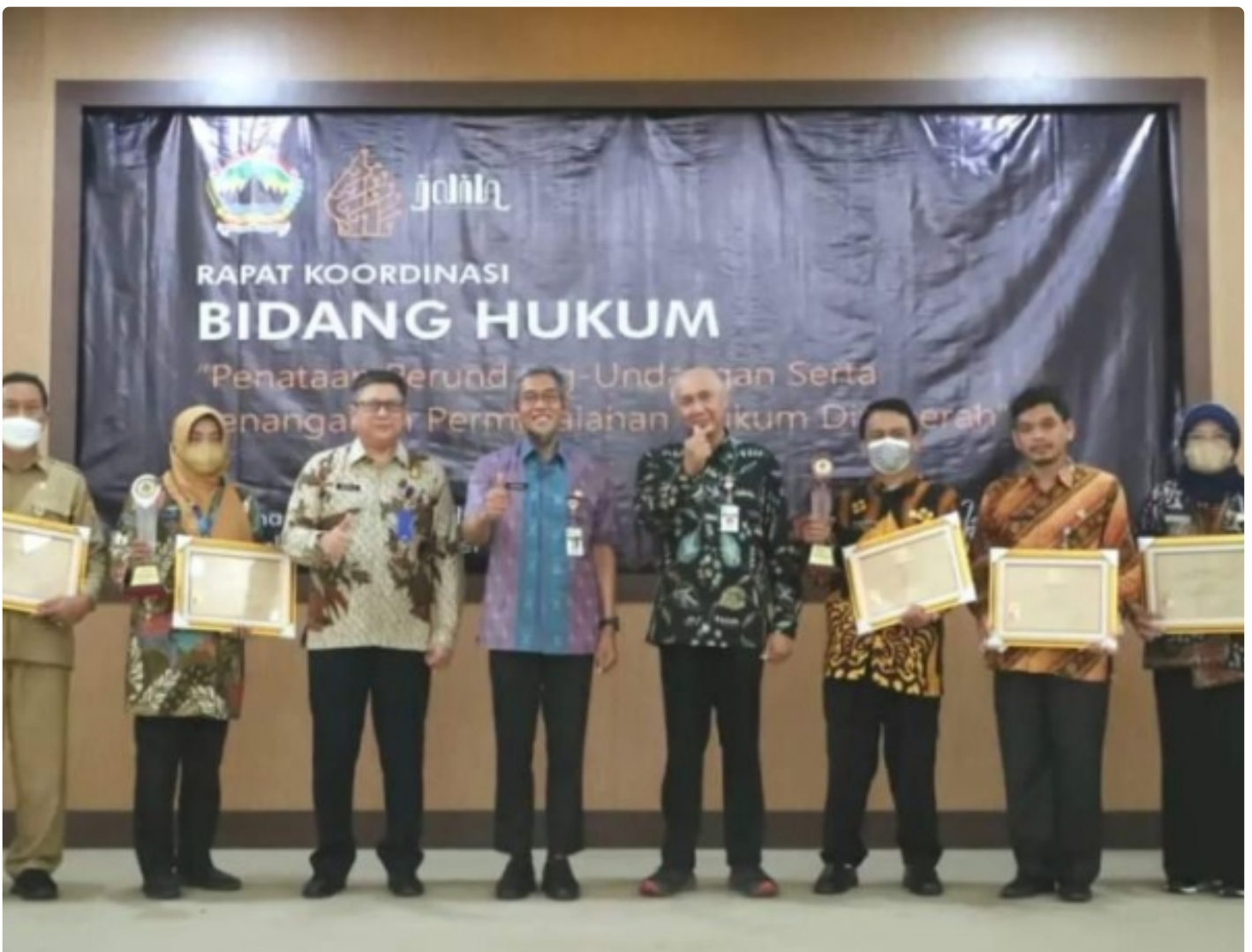
Kemenkumham Jateng Ikuti Rapat Koordinasi Bidang Hukum Provinsi Jawa Tengah Tahun Anggaran 2022

BOYOLALI - Guna membangun sinergitas dalam pembinaan pengelolaan Jaringan Dokumentasi dan Informasi Hukum (JDIH), Kantor Wilayah Kemenkumham Jawa Tengah mengikuti Rapat Koordinasi Bidang Hukum